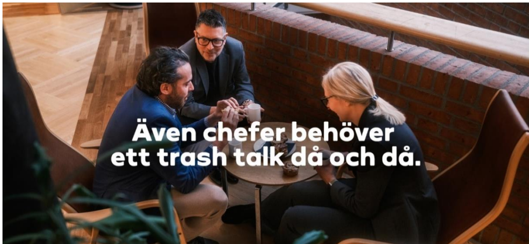
Exempel på kampanjmaterial för Trash Talk.