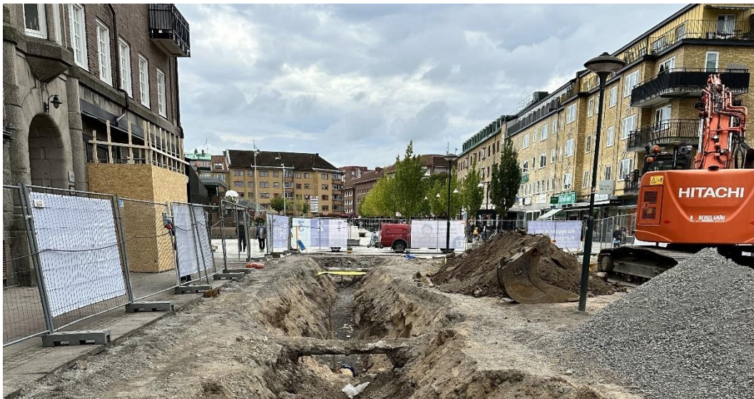
Byte av ledningar i centrala Trollhättan.

Här presenterar vi ett urval av projekt, aktiviteter och åtgärder som genomförts under året. Mer information och framsteg i samtliga projekt hittar du på vår webbplats trollhattanenergi.se/projekt och i vårt nyhetsarkiv trollhattanenergi.se/nyheter/2023 .